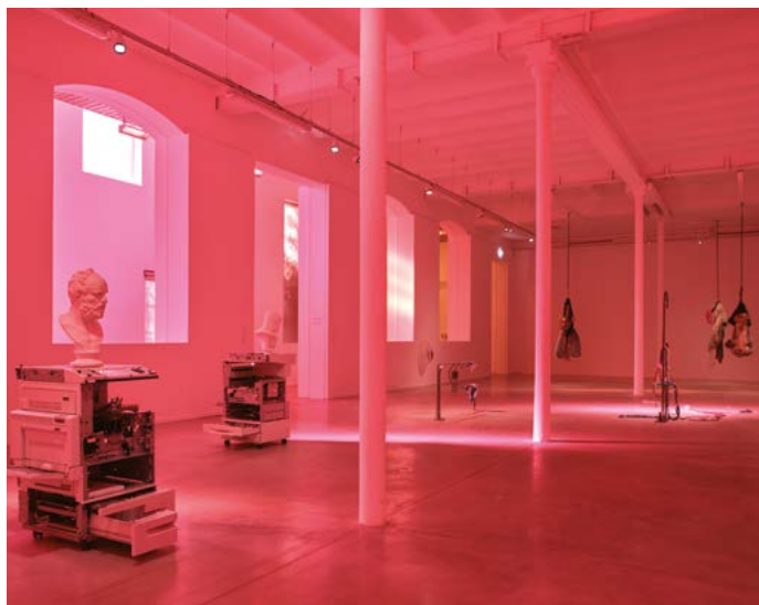
MO.CO. Panacée → Exposition Permafrost. Les formes du désastre Exposition du 1er février au 30 août 2020 Vue d'ensemble