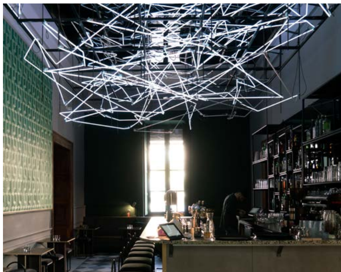
MO.CO. Hôtel des collections ← Café/restaurant Le Faune

Loris Gréaud, Idle Mode , 2019 MO.CO. Hôtel des collections Suspension lumineuse en néons et fragments sonores du livre Révolution électronique de William S. Burroughs, interprétés par Abel Ferrara.