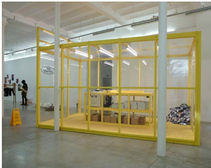
MO.CO. Panacée Healthy Boy band ← Exposition Cookbook'19 du 8 février au 12 mai 2019 Curators : Nicolas Bourriaud & Andrea Petrini © Marc Domage