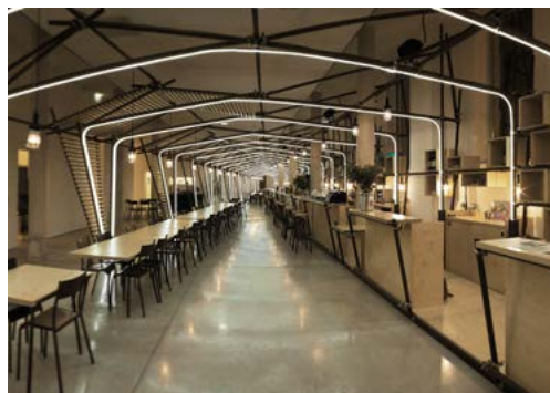
MO.CO. Hôtel des collections → Café/restaurant Le Café de La Panacée

24 lignes , 2013 MO.CO. Panacée Installation sculpturale et lumineuse 24 lignes lumineuses accrochées à une structure d'échafaudage rouille et programmées pour différents comportements respiratoires réalisées par 1024 architecture.