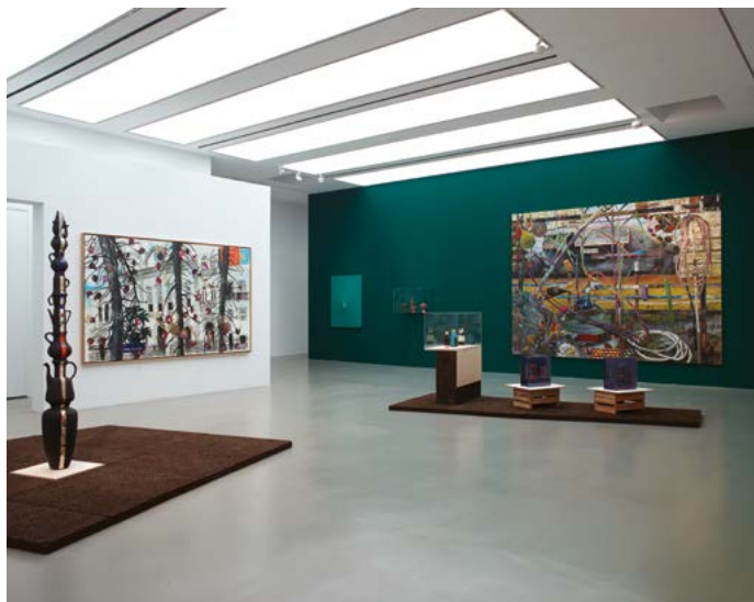
MO.CO. Hôtel des collections ← Exposition Mecarõ. L'Amazonie dans la collection Petitgas du 6 mars, au 20 septembre 2020 Vue d'ensemble © Marc Domage