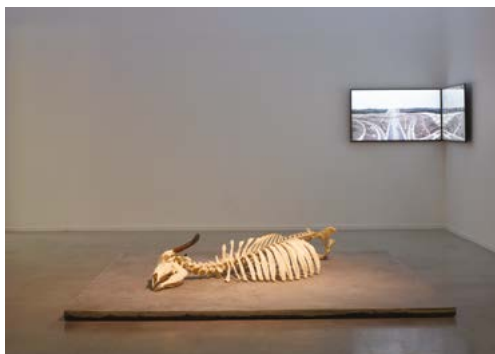
MO.CO. Panacée → Exposition Permafrost. Les formes du désastre Özan Atalan, Monochrome , 2019

Œuvre co-produite par la 16 ème biennale d'Istanbul et MO.CO. Montpellier Contemporain