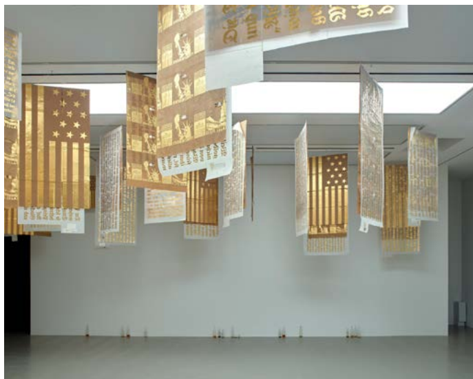
Danh Vo MO.CO. Hôtel des collections ← Exposition Distance intime. Chefs-d'œuvre de la collection Ishikawa Exposition inaugurale du 29 juin au 29 septembre 2019