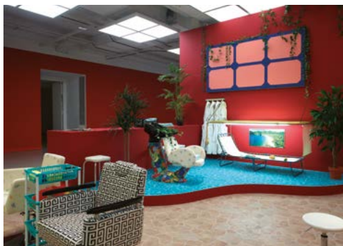
MO.CO. Hôtel des collections → Sol Calero, Bienvenidos a Nuevo Estilo, 2014 Exposition Mecarõ. L'Amazonie dans la collection Petitgas du 6 mars, au 20 septembre 2020

MECARÕ. L'AMAZONIE DANS LA COLLECTION PETITGAS