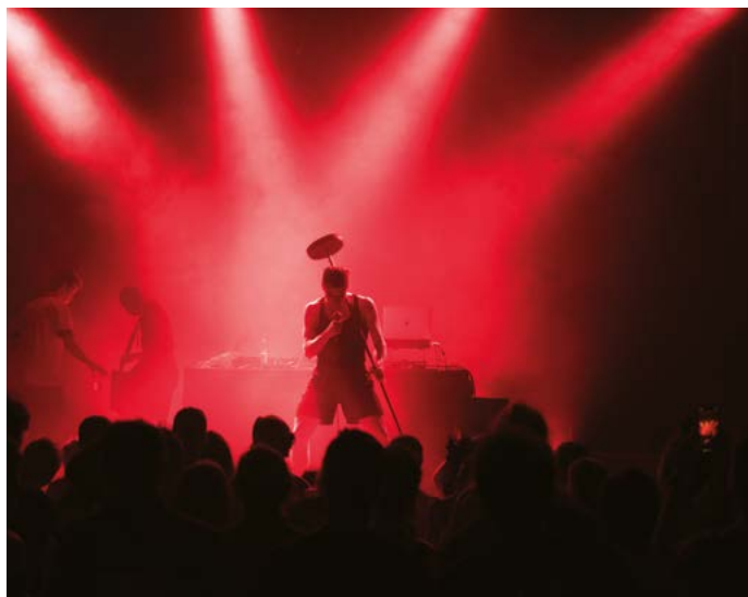
← Nelson Beer au Rockstore le 29 juin 2019