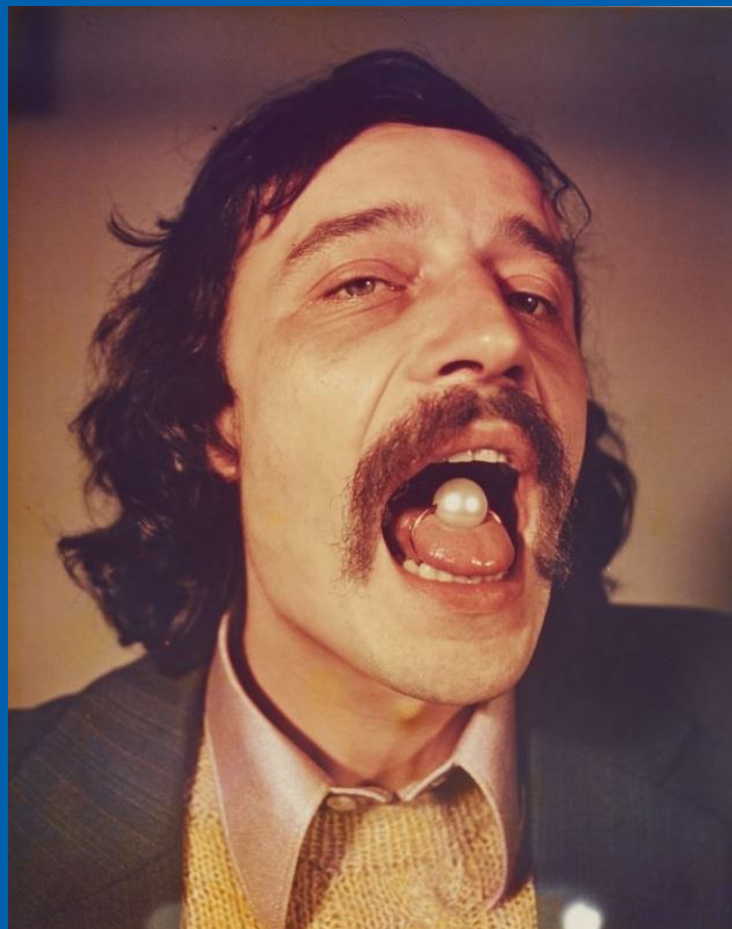
Komar & Melamid, Catalogue des superobjets de superconfort pour les superhommes, 1976-1977