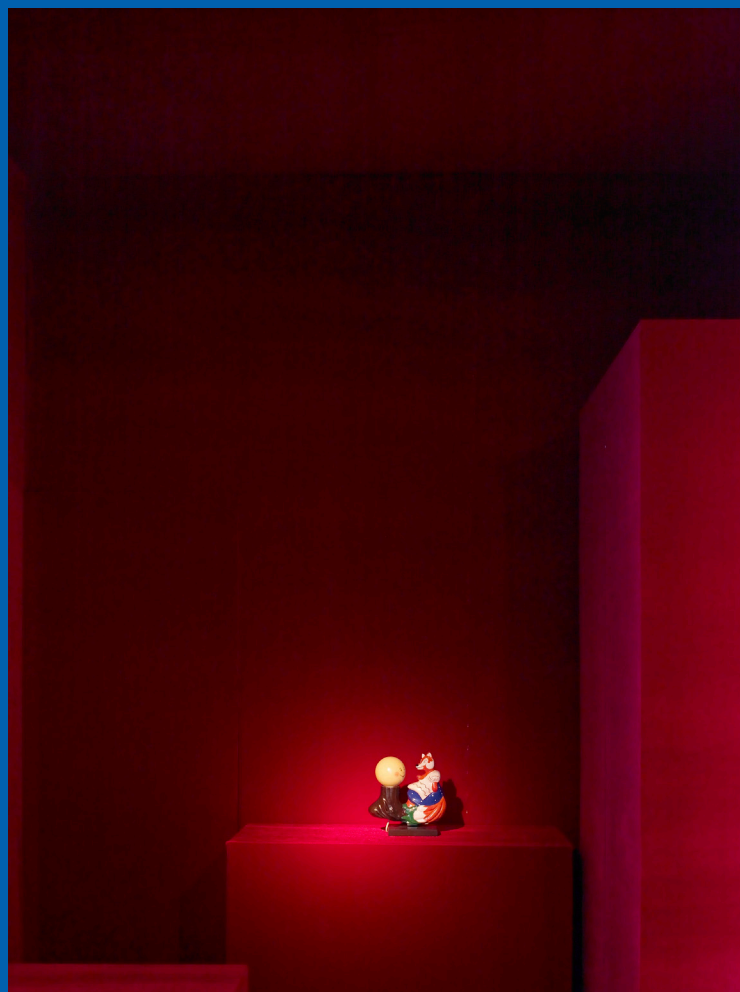
INSPECTION HERMÉNEUTIQUE MÉDICALE