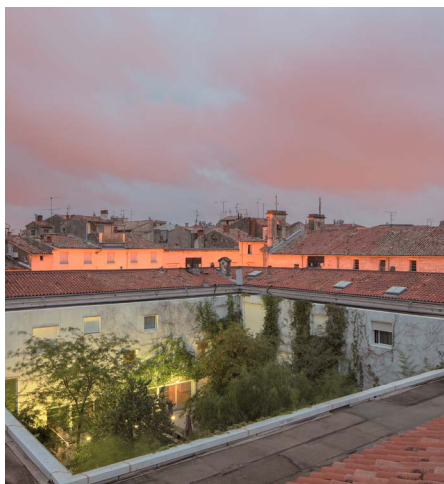
MO.CO. Panacée