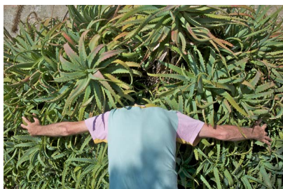
Jean-Luc Vilmouth, Nature and me , 2015 © Adagp, Paris, Collection White-Vilmouth