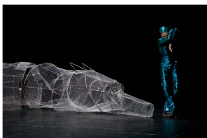
Mathilde Monnier Please, please, please , 2021