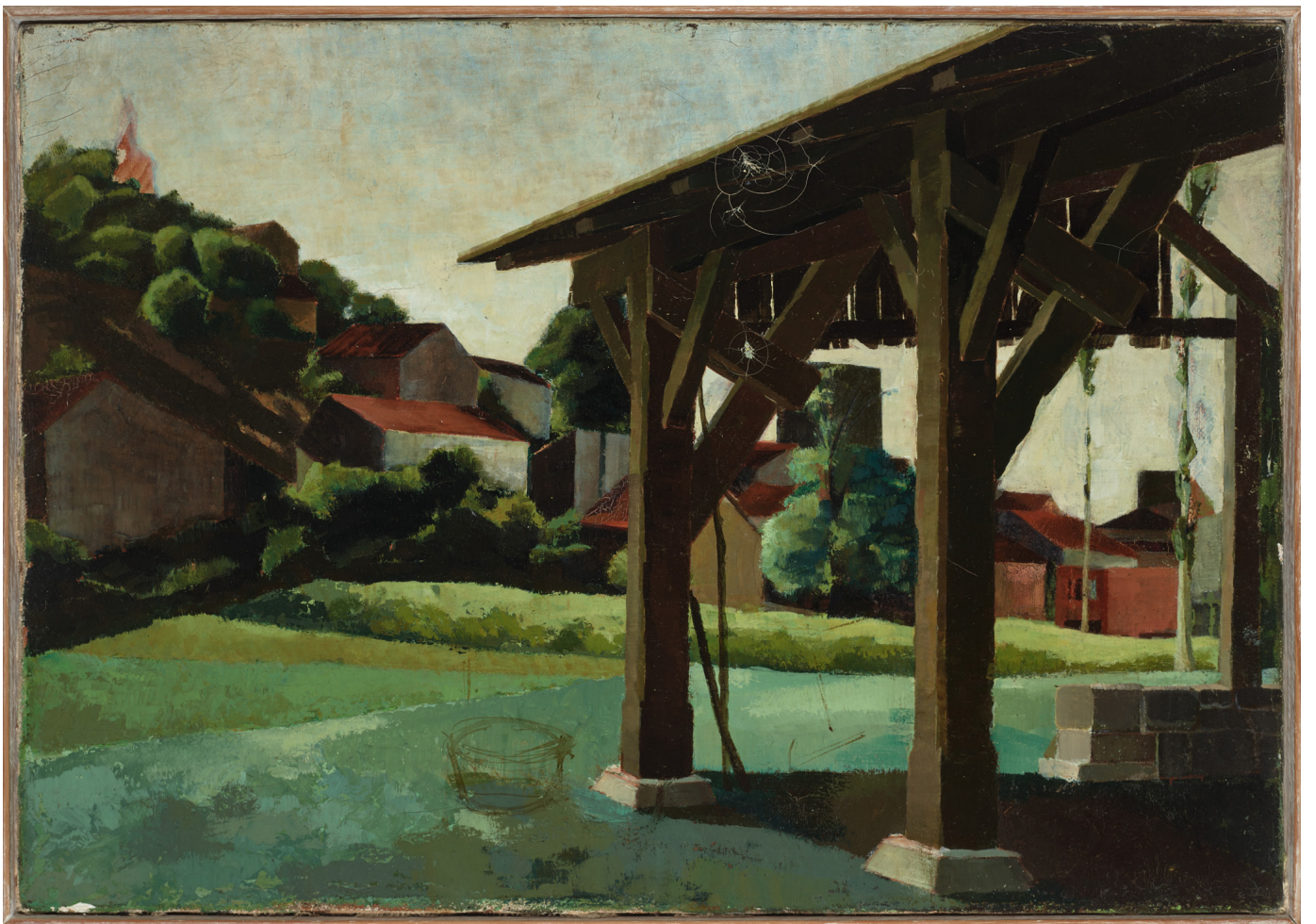
Bernard Pagès, Paysage au hangar , 1964, Huile sur toile, 55 x 38 cm, Collection Desbiolles/Pagès