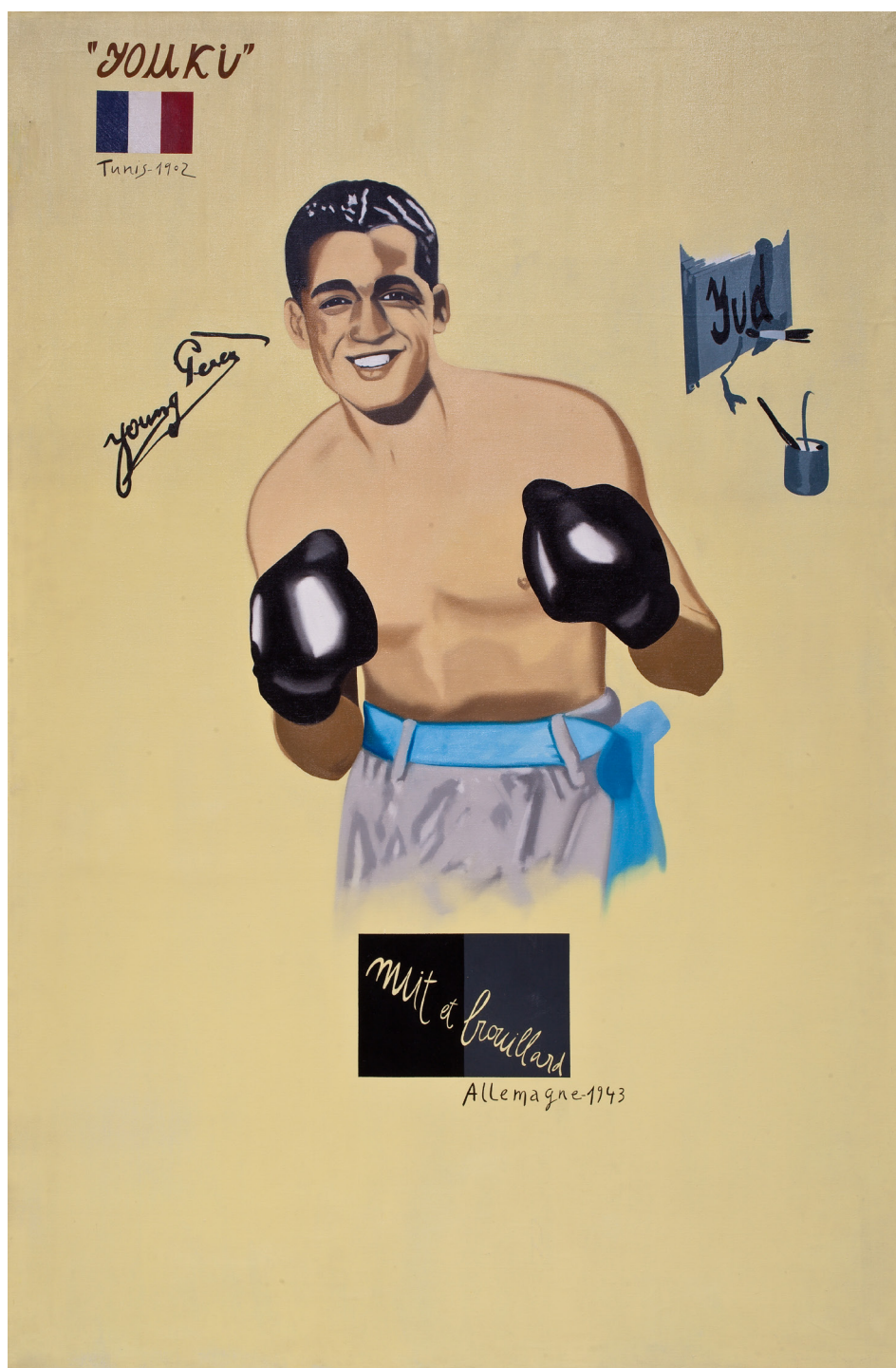
Young Pérez, 1983, Huile sur toile, 195 x 130 cm, Collection Pimpi Arroyo © Adagp, Paris, 2024