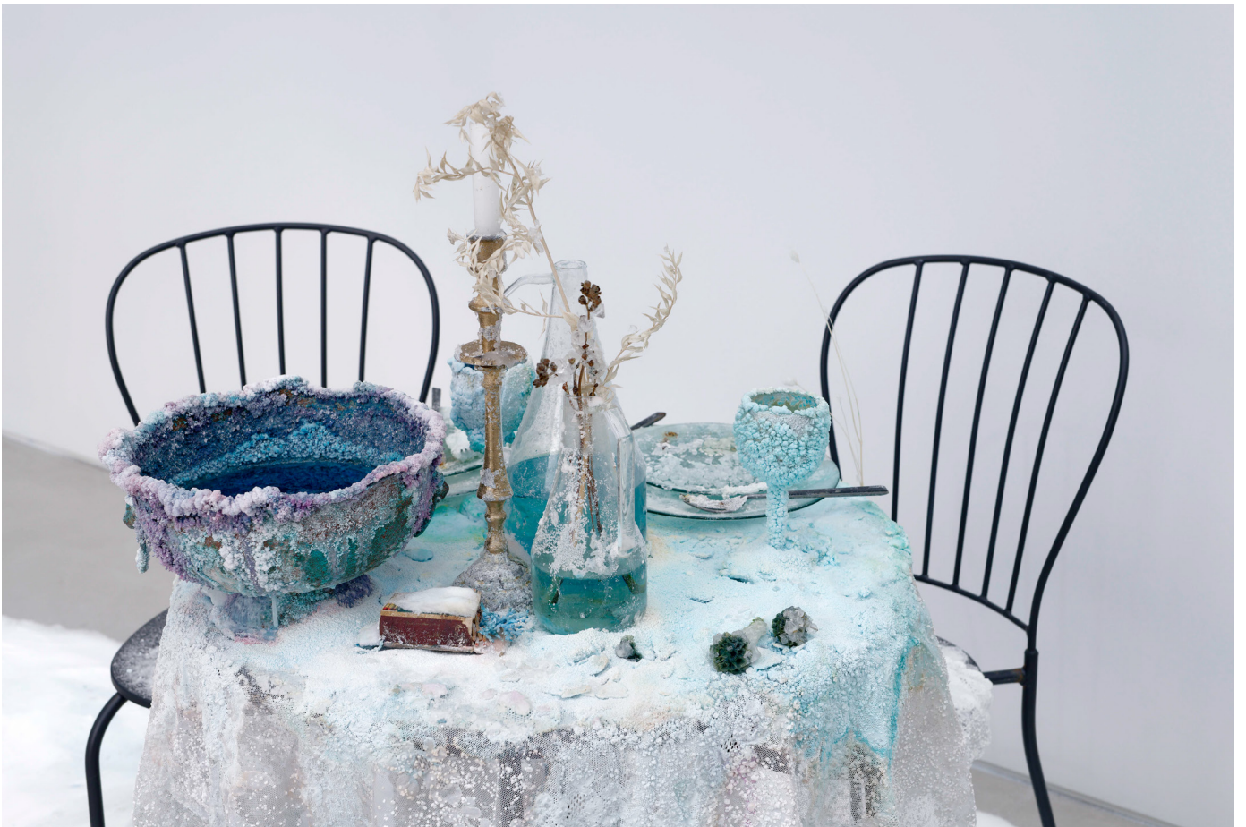
Bianca BONDI, The private lives of non - human entities [La Vie privée des entités non humaines], 2020, meubles et objets divers, eau salée, fleurs séchées, sel, néon/Dimensions variables, mor charpentier, Paris