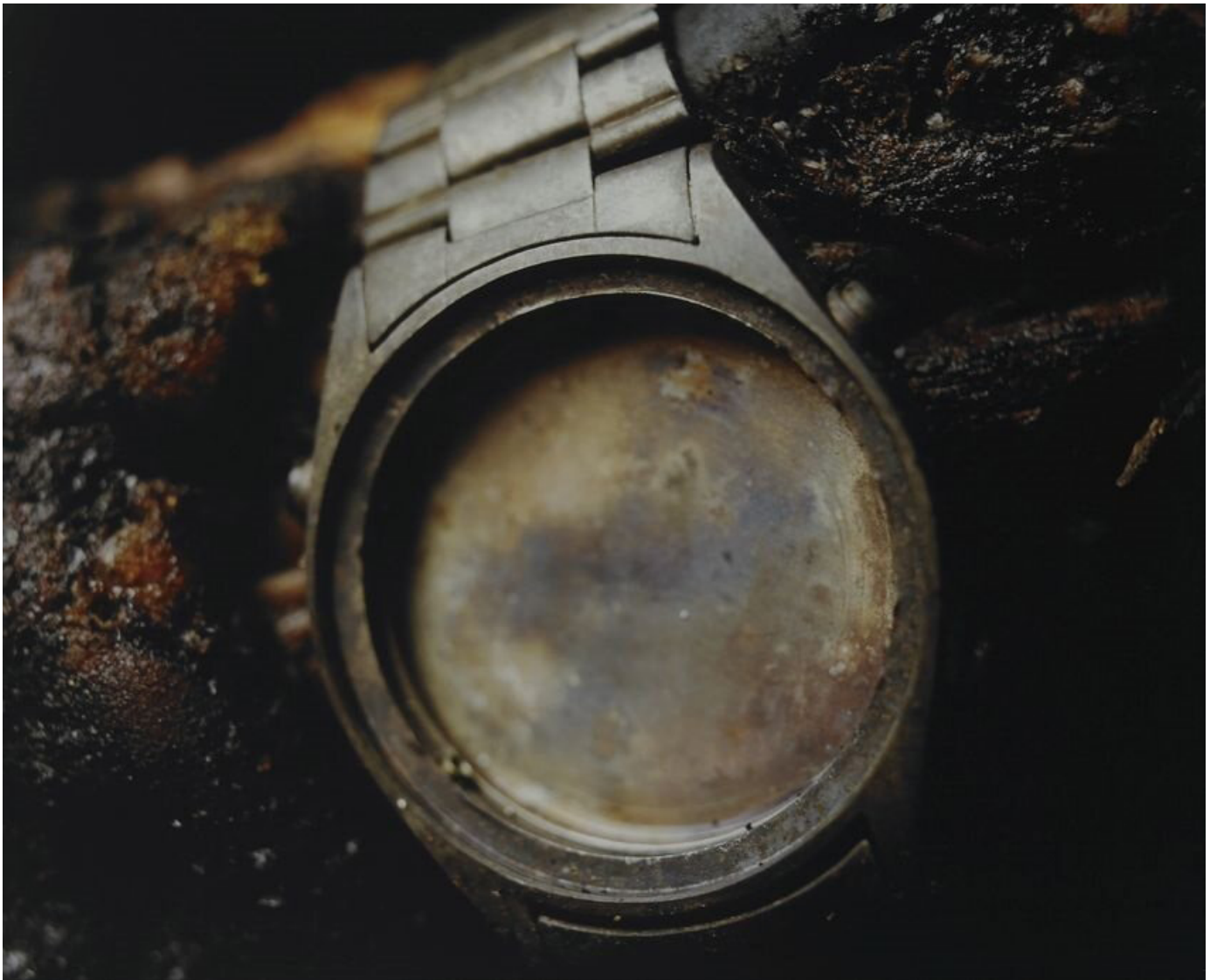
Andrés Serrano, Airplane Crash (The Morgue) [Accident d'avion (La Morgue)] 1992, 125 x 152 cm/Tirage cibachrome, plexiglass, cadre en bois Collection Francès