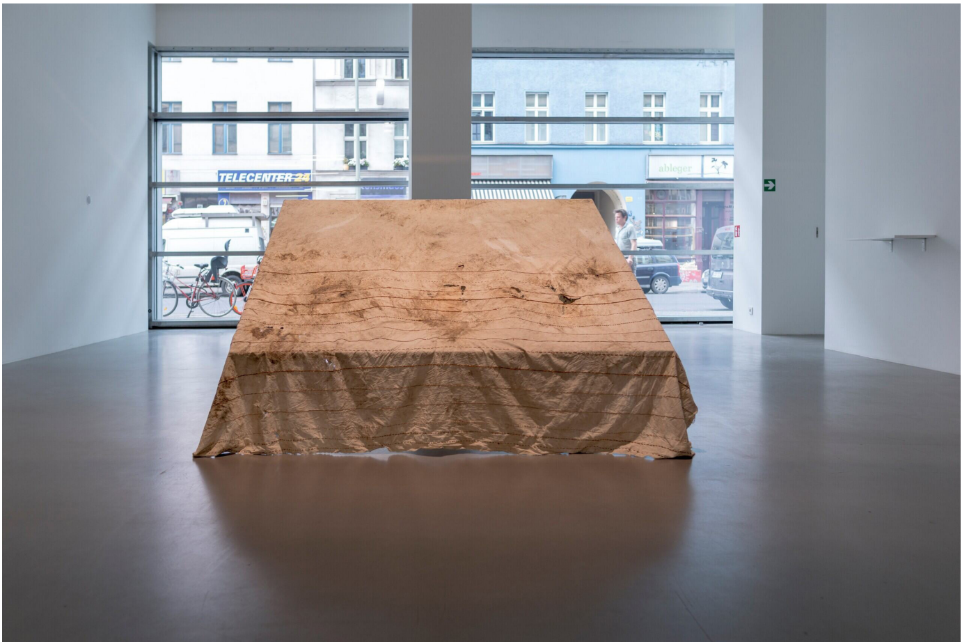
Teresa MARGOLLES, Los Otros [Les Autres] , 2018, Tissu brodé de 14 lignes de fil rouge, dimensions variables, mor Charpentier, Paris Madrid Teresa Margolles : tissu brodé de 16 lignes de fil rouge, 14 enregistrements sonores/Livret anglais, espagnol et français