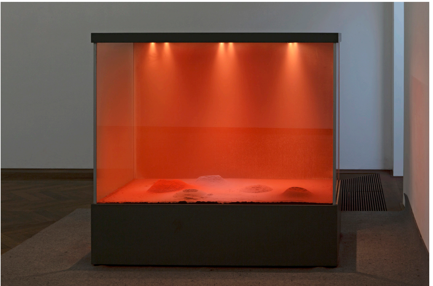
Dora BUDOR, Origin II (Burning of the Houses) [Origine II (L'Incendie des maisons)], 2019, verre, pigment, aluminium, acrylique, bois, poussière, 152 x 160 x 86 cm, Lafayette anticipations - Fonds de dotation Famille Moulin

Dora Budor se sert des films de science-fiction pour créer ses œuvres. La science-fiction raconte des histoires qui se passent dans le futur ou dans des mondes inconnus.