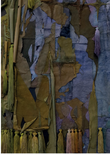
Nour Jaouda Everything touches everything else (détail) , 2022 Teinture et pigments sur toile, acier 170 x 80 x 15 cm Collection Alia Al-Senussi Courtesy de l'artiste et Union Pacific