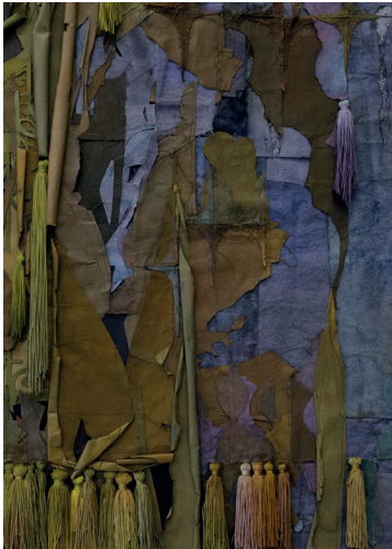
Nour Jaouda Everything touches everything else (détail) , 2022 Teinture et pigments sur toile, pompons teints à la main, acier 170 x 80 x 15 cm Collection Alia Al-Senussi