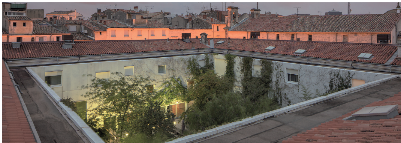
MO.CO. Panacée