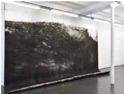
↑ Célia MÜLLER J'ai fait un rêve #2 , 2020 Pigments d'oxyde de fer noir sur papier 400 x 544 cm

Quel que soit le sujet de la toile, la dimension de l'œuvre a un impact certain sur sa perception. Impliquant différemment le corps du spectateur et son regard, elle nécessite parfois de s'éloigner, de se rapprocher voire de parcourir la peinture. Dans cette exposition, de nombreuses œuvres - en une ou plusieurs parties, sur châssis ou sur toile libre - sont de très grands formats. Comment ces données formelles influencent-elles notre perception ?