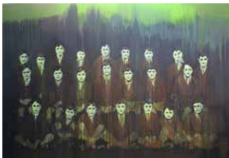
↑ Claire TABOURET Série Les Insoumis, La classe , 2013 Acrylique sur toile 260 x 390 cm

Portraits de personnages importants, autoportraits ou portraits de groupe, que nous disent les artistes sur leur époque et sur ses codes en réalisant des portraits qui respectent ou qui détournent les règles du genre ?