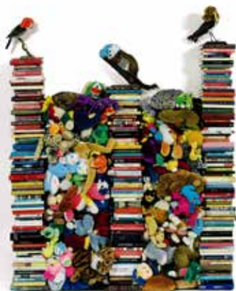
↑ Annette MESSEGER Fables et récits, 1991-2007 Animaux en peluche et livres 181 x 145 x 20 cm

Spoerri crée en 1960 ses premiers « tableaux-pièges » en collant sur des planches des objets quotidiens ramassés dans sa chambre d'hôtel. Passant d'un plan horizontal à un plan vertical, ils acquièrent une présence insolite. Ce travail le conduit à rejoindre le groupe des Nouveaux Réalistes lors de sa fondation en 1960 : « Je ne mets - dit-il - qu'un peu de colle sous les objets, je ne me permets aucune créativité. »