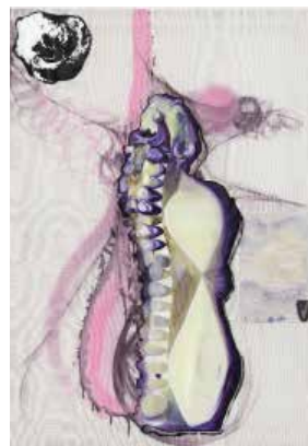
↑ Pierre Unal-Brunet, LAUGHING GILLS , 2024 Toile de jute sur châssis aluminium, encre, acrylique, gesso, papier recyclé, colle epoxy, débris de plastique