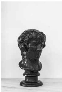
↑ Raphaël DENIS BLACK PLÁSTERS : ANTIPOUS EN BACCHUS [Plâtres noirs : Antinous as Bacchus], 2022 Plâtre, gomme arabique et encaustique 58,5 x 31,5 x 31,5 cm

Claire Tabouret travaille le genre du portrait, individuel ou de groupe. La série Les insoumis s'inscrit dans la continuité d'une exposition axée autour du regard dérangent, en particulier celui d'enfants. Les figures semblent tout autant apparaître que disparaître. Malgré un fond atemporel, la pose et les vêtements des enfants laissent deviner une grande tension suggérant que la guerre est proche. Ce portrait d'écoliers donne à voir une jeunesse qui semble s'effacer dans l'incertitude d'un possible futur.