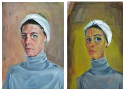
↑ Nina CHILDRESS Autoportrait avec le turban de Simone de Beauvoir (799) , 2008 Huile et acrylique sur toile 46 x 33 cm et Autoportrait avec le turban de Simone de Beauvoir, d'après Francis Grüber (803) , 2008 Huile et acrylique sur toile 61 x 38 cm © Adagp, Paris, 2024

L'œuvre de Bruno Perramant est peuplée de fantômes : des références littéraires, cinématographiques ou artistiques qu'il intègre à son travail. La composition de cette peinture est inspirée d'un tableau de Goya intitulé L'enclos des fous . Bruno Perramant remplace le ciel par une pluie de fleurs, elles-mêmes inspirées par les peintures de Damien Cadio dont il a "vampirisé" le travail à l'occasion d'une exposition commune à la Galerie Dukan.