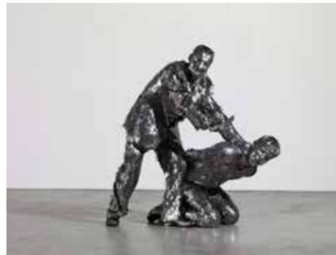
↑ Adel ABDESSEMED Untitled [Sans titre], 2014 Lame de scalpel, polyuréthane usiné CNC, nylon et graphite imprimé en 3D 140 x 125 x 90 cm © Adagp, Paris, 2024

À l'occasion de l'exposition L'esprit français. Contre-cultures 1969-1989 présentée à la Maison Rouge, Kiki Picasso a imaginé cette série de peintures inspirée par ces deux décennies. Chaque toile correspond à une année pour laquelle l'artiste a choisi un ou deux événements français marquants. Avec des couleurs criardes, il combine ainsi différentes images issues des médias. Pour l'exposition au MO.CO., les peintures sélectionnées correspondent aux années 1974, 1980 et 1987/88.