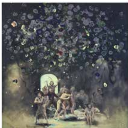
↑ Bruno PERRAMANT Flowers (Goya) [Fleurs (Goya)], 2018 Huile sur toile 200 x 200 cm

De tous temps, les artistes n'ont cessé de s'inspirer les uns des autres. L'histoire de l'art est ainsi emplie de références, de citations, d'hommages ou d'emprunts. Pour certains, c'est aussi une façon d'inscrire leur pratique dans une forme de filiation, ou de se confronter au travail d'autres artistes.