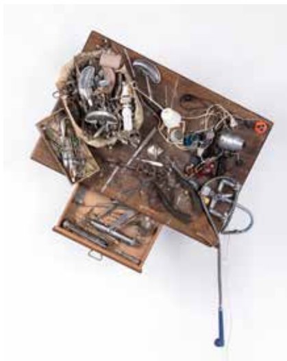
↑ Daniel SPOERRI Palette (Heberstoft) , 1989 Instruments chirurgicaux, objets divers, ampoules et système lumineux sur palette 104 x 100 x 97 cm © Adagp, Paris, 2024

Rejoignant la démarche du collectionneur, certains artistes accumulent des objets ou les détournent afin de les inclure dans leurs œuvres. L'intervention de l'artiste est parfois minime. La mise en scène des objets devient alors primordiale.