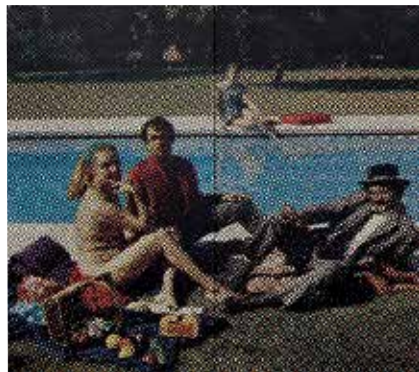
↑ Alain JACQUET Déjeuner sur l'herbe , 1964 Peinture acrylique et sérigraphie sur toile (diptyque) 172,5 x 196 cm © Adagp, Paris, 2024

Jusqu'à cette œuvre réalisée pour son diplôme de fin d'étude, Célia Müller ne travaillait que sur des petits formats. Le titre J'ai fait un rêve #2 vient de ce désir de s'éloigner de sa pratique habituelle. L'énorme vague en oxyde de fer semble sortir du mur et du sol pour englober le spectateur. Ce point de vue sur la vague est impossible, irréel et renvoie à la dimension onirique du titre.