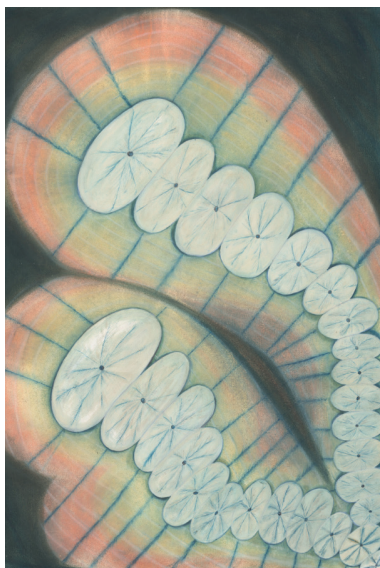
Anna Zemánková, Sans titre , c. 1960, pastel et huile de cuisine sur papier, 84 x 59 cm.

Après une saison consacrée à la peinture figurative contemporaine en France (printemps 2023), puis aux liens entre l'art et la littérature (printemps 2024), MO.CO. Montpellier Contemporain propose ce printemps trois expositions sur ses deux centres d'art qui explorent les relations entre l'art et la science.