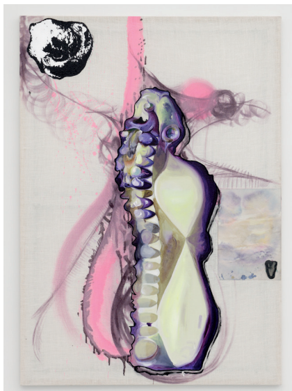
Pierre Unal-Brunet, LAUGHING GILLS , 2024, coproduction de l'artiste et du CCC OD, Tours. Photo : Aurélien Mole. © Adagp, Paris, 2024

Pierre Unal-Brunet est né en 1993 en France et vit à Paris et Sète. Il glane des matériaux inertes, débris et autres surplus du monde issus de zones de récolte aqueuses. Il les assemble pour former des êtres-objets au sein d'installations mêlant peintures, sculptures et dessins à l'encre. Avec une approche de l'évolution à la frontière de la cryptozoologie, ses recherches puisent dans des articles scientifiques issus de l'ichtyologie (l'étude des poissons) et de la biologie marine, comme dans des affabulations sur ces territoires de récolte. En résulte un environnement science-fictionnel habité de corps composites.