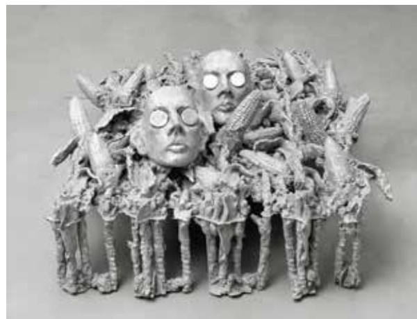
Jean-Marie Appriou, The breath of the suns, 2018 Fonte d'aluminium