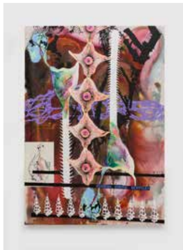
Pierre UNAL-BRUNET HUGGING DERMAL DENTICLES, 2022 Toile de jute sur châssis en aluminium, encre, acrylique, gesso, impressions jet d'encre, papier recyclé, bindex, peinture aérosol, pigments, guanine. © Adagp, Paris, 2025

Cette figure chimérique mi-insecte mi-humaine est un alliage de plusieurs matériaux. Sur quatre grandes pattes arachnoïdes métalliques se dresse un buste décharné en albâtre qui révèle des éléments fragiles : un noyau rose apparemment doux et humide et une bulle de verre, comme un élément respiratoire extérieur au corps. L'attitude de la créature est énigmatique : elle semble reculer, tête baissée. Incarnant à la fois la violence et la vulnérabilité, le grotesque et le sensuel, cette œuvre traite d'altérité et interroge la nature dans son lien avec l'homme et la machine.