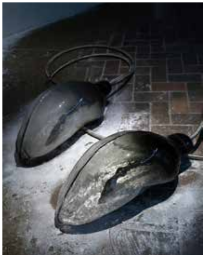
Ivana BAŠIĆ Hypostasis , 2024 [Hypostasé] Verre soufflé, haleine, poussière, tuyau d'échappement de voiture de course

Les deux artistes exposés au MO.CO. Panacée ont des univers très différents mais accordent tous deux une grande importance à la matérialité de leurs œuvres. Les matières utilisées, qu'elles soient traditionnellement utilisées pour la sculpture ou détournées de leur destination première, sont chargées d'une force symbolique et esthétique.