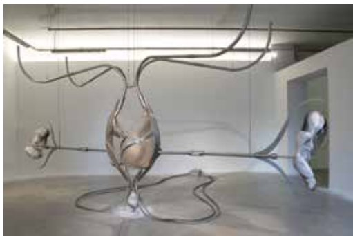
Ivana BAŠIĆ Passion of Pneumatics (2024) [ Passion des Pneumatiques ] Moulage sur mesure, verre soufflé, acier inoxydable, albâtre rose, soufflé, marteaux pneumatiques, pression, collecteurs d'échappement de voitures de course sur mesure, circuit sur mesure, microphones, mélangeur, haut-parleurs, compresseur d'air, cire, albâtre blanc, bronze, peinture à l'huile

Ivana Bašić et Pierre Unal-Brunet se sont appropriés les espaces du MO.CO. Panacée en proposant au visiteur une expérience immersive dans laquelle plusieurs sens sont sollicités.