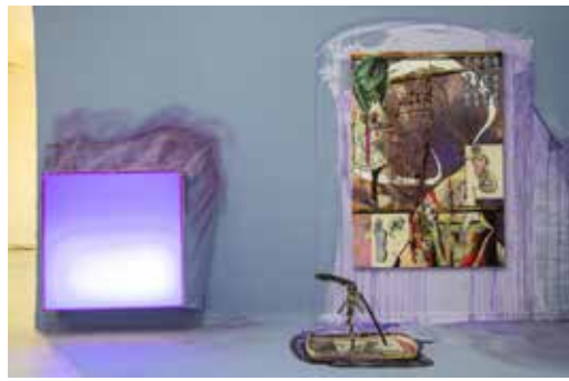
Pierre UNAL-BRUNET Sans titre (LAUGHING GILLS #10) , 2024 Vue d'exposition, « Prodrome. Pierre Unal-Brunet », MO.CO. Panacée, Montpellier, 2025. © Adagg, Paris, 2025. Courtesy de l'artiste. Photo : Marc Domage

Le titre de l'exposition fait référence à la pièce centrale de l'exposition qui s'étend sur sept mètres de long. Le son est une donnée importante dans la pratique d'Ivana Bašić, qui travaille en écoutant des compositions en boucle afin de s'extraire du temps et de l'espace et de créer dans un état méditatif. Pour cette œuvre, elle mixe le son de son souffle avec une composition musicale d'Eliane Radigue. L'ensemble est synchronisé avec le pilonnage robotisé du cœur en albâtre au centre de l'œuvre. Tous ces sons ainsi que la monumentalité de l'œuvre et la lumière froide de la pièce participent à plonger le visiteur dans une atmosphère étrange.