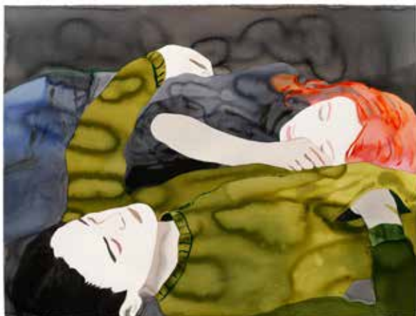
Françoise Pérovitch Sans titre, 2024 120 x 160 cm / 47 1/4 x 63 inches Lavis d'encre sur papier Courtesy Sepiuse, Paris Photo : Pauline Assathiany ©Adapp, Paris, 2025