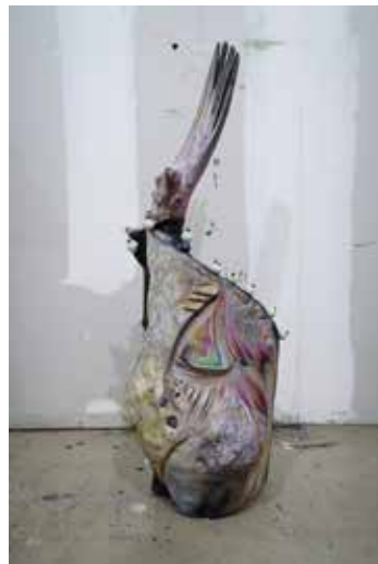
Pierre UNAL-BRUNET Regalecus glesne , 2022 Bois flotté, guanine, textile, coquilles de palourdes et d'huîtres, pieds de pélican, verre poli, débris de plastique, perle, acrylique, peinture à l'huile et en aérosol, graphite, colle époxy, toile de jute © Adagp, Paris, 2025

Dans la pratique d'Ivana Bašić, les matériaux sont choisis pour leurs qualités plastiques mais également pour leur force symbolique. Ainsi, ces œufs de verre translucides sont remplis de poussière et du souffle de l'artiste. Ils sont hermétiquement fermés et en attente d'éclosion, incarnant le potentiel des forces vitales. La présence de la respiration ajoute une dimension immatérielle. Le souffle (pneuma) est un symbole central dans de nombreuses traditions anciennes représentant la vie, l'esprit et la présence divine. Anonyme et irréductible, la poussière représente le cycle de la vie et la libération du monde matériel.