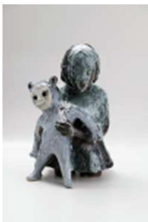
Tenir , 2019