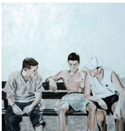
Jean-Baptiste DURAND Sur le banc , 2009 Huile sur toile

Depuis 2021, SOL ! La biennale du territoire met en lumière la vitalité de la création contemporaine en Occitanie. Pour cette troisième édition, le MO.CO. et le musée Fabre nouent un partenariat exceptionnel pour rendre hommage à un acteur majeur de la vie artistique montpelliéraine : l'École des beaux-arts. Cette exposition permettra d'explorer une histoire riche, longue et parfois méconnue, où se mêlent héritage académique, expérimentations radicales et ouverture vers l'international.