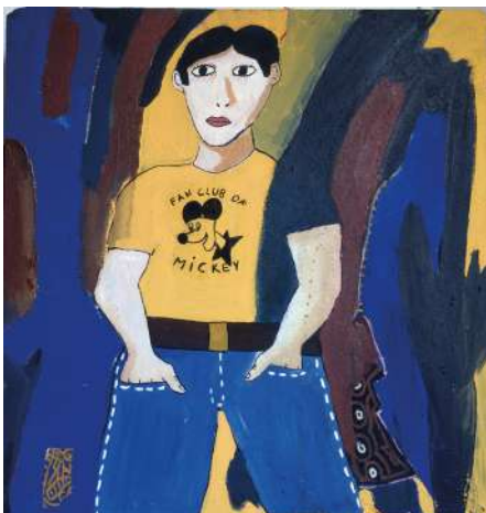
Robert COMBAS Membre du fan club Mickey [...], 1979 Acrylique sur bois, 100 x 97 cm Collection de l'artiste © Adagp, Paris 2025