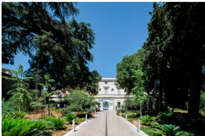
MO.CO. Montpellier contemporain, 2022