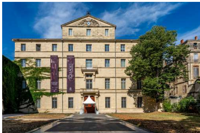
Musée Fabre, 2025