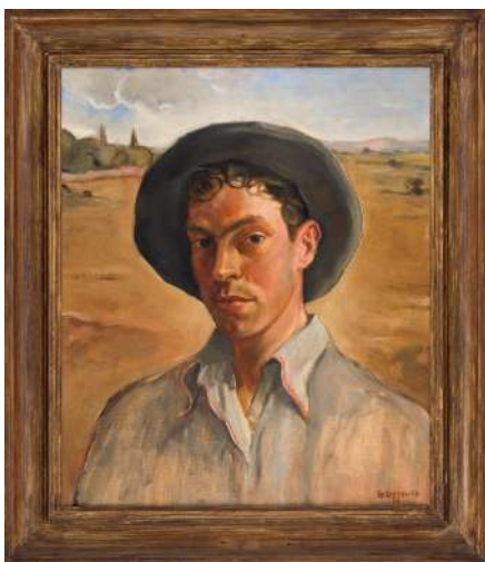
Georges DEZEUZE Portrait de l'artiste , 1937 Huile sur toile, 55,70 x 46,50 x 2 cm Collection Musée Fabre, Montpellier

Cet événement met également à l'honneur la collection du musée Fabre, qui conserve les fonds de référence de plusieurs artistes formés à Montpellier. Les œuvres d'art graphiques, donations et documents d'artistes rarement présentées au public sont particulièrement mobilisées pour offrir un aperçu exceptionnel de ces deux siècles d'histoire. L'exposition permet enfin de souligner la manière dont, à travers le MO.CO., Montpellier propose aujourd'hui un modèle unique en France : une institution intégrée qui relie formation, production, exposition et collection, et qui fait dialoguer patrimoine et création contemporaine.