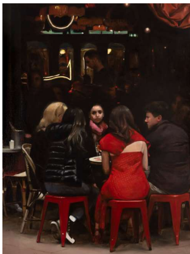
Bilal HAMDAD Vermillon , 2024 Huile sur toile, 162 x 130 cm Courtesy galerie Templon © Adagp, Paris, 2026