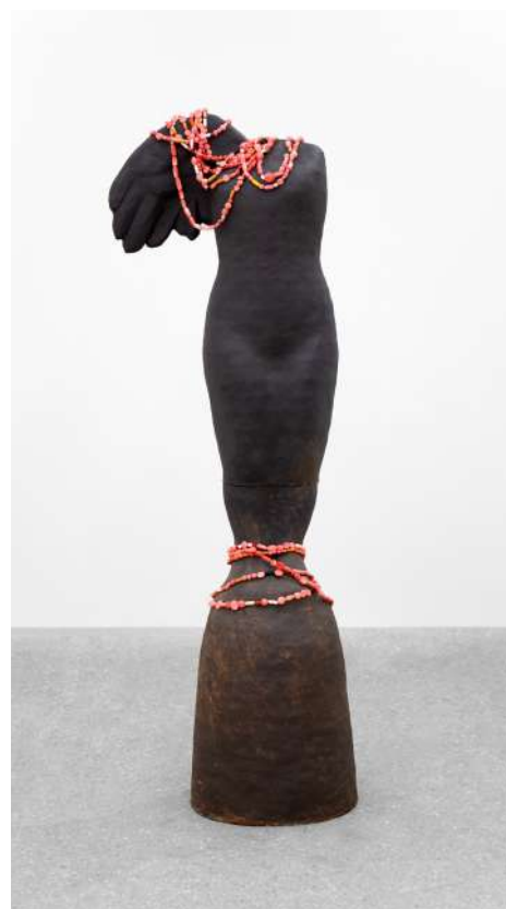
Nina JAYASURIYA Ange Mercure, 2025 Grès, médicaments, mercurochrome 160 x 70 x 45 cm