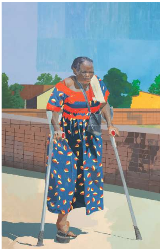
David MBUYI Miroir , 2023 Huile sur toile, 228 x 146 cm