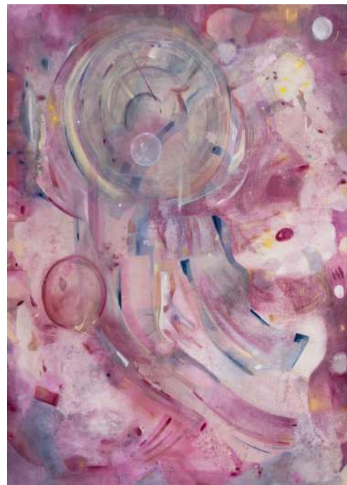
Mathilde DENIZE Sound of Figures , 2025 Acrylique et aquarelle sur toile, paillettes 200 x 160 cm Courtesy de l'artiste et Perrotin. Production Frac Île-de-France Photo : Tanguy Beurdeley © Adagp, Paris, 2026