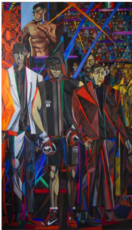
Raphaëlle BENZIMRA Portrait de Dmitry Bivol, 2024 Huile sur toile, 195 x 114 cm