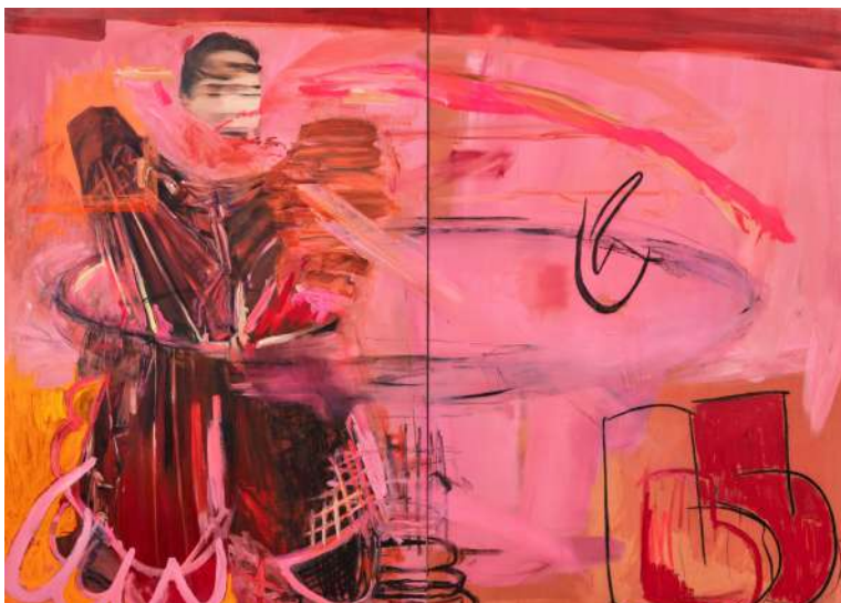
Dora JERIDI Where to go? How to go? , 2023 Huile, bâton d'huile, fusain sur toile, 195 x 260 cm Collection Société Générale. Courtesy Perrotin © Adagp, Paris, 2026