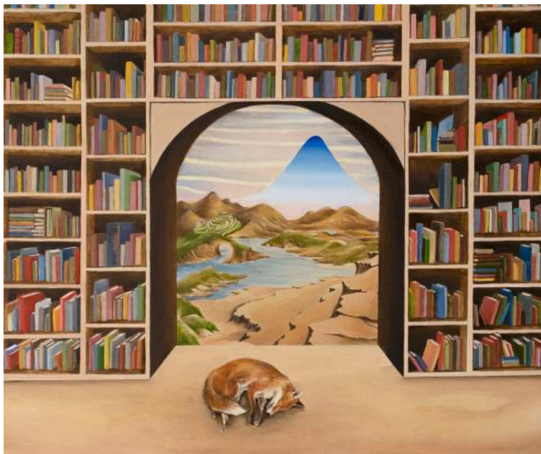
Zélie NGUYEN La bibliothèque de babel, 2023 Huile sur bois, 46 x 38 cm Collection privée. Courtesy By Lara Sedbon © Zélie Nguyen