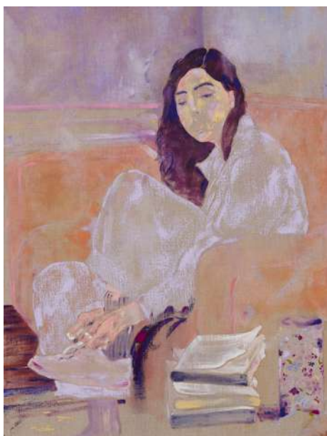
Djabril BOUKHENAÏSSI Tes trente ans , 2025 Huile et pastel sur toile, 80 x 54 cm Courtesy de l'artiste et Mariane Ibrahim Photo : Fabrice Gousset © Adagp, Paris, 2026