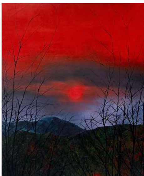
Fabien CONTI Soleil rouge , 2025 Huile sur toile, 200 x 180 cm

En écho à l'exposition que le MO.CO. consacre à l'histoire de l'École Supérieure des Beaux-Arts de Montpellier (MO.CO. Esba), le MO.CO. Panacée propose une réflexion autour d'un « cas d'école » : l'atelier de Djamel Tatah aux Beaux-Arts de Paris. Professeur pendant quinze années au sein de cette institution, Djamel Tatah a formé une génération d'artistes dont la diversité des pratiques, la singularité des trajectoires et la rapide émergence sur la scène nationale intriguent.