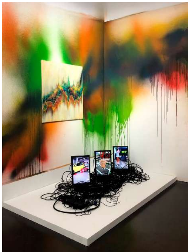
Pierre PAUZE Draw me a bull , 2025 Huile sur toile, 150 x 150 cm Peinture murale, 3 écrans, câbles, dimensions variables © Adagp, Paris, 2026