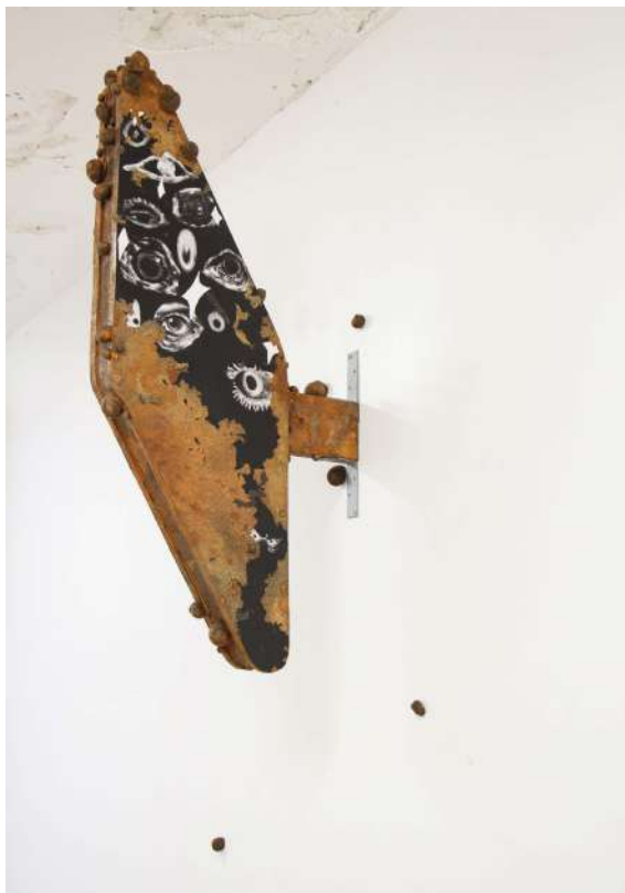
Tristan CHEVILLARD La gorge du dragon (Post-industrial effigy) a tribute to Gyaos , 2025 Matériaux mixtes, dimensions variables