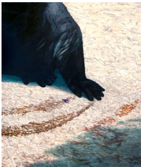
Blaise SCHWARTZ Mouvement au sol , 2023 Huile sur toile, 100 x 80 cm Courtesy de l'artiste © Blaise Schwartz