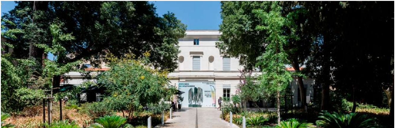
MO.CO. Montpellier contemporain, 2022