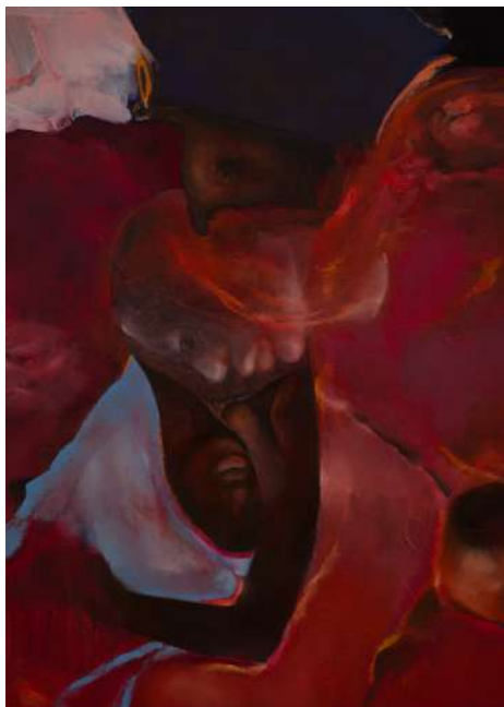
Clémence GBONON Secret Gardens , 2024 Huile sur toile, 116 x 89 cm Collection privée

cette constellation, ce qui relie ses artistes n'est pas une esthétique commune mais l'expérience partagée d'avoir été accompagnés dans leur devenir artiste. Plus qu'un héritage formel, l'exposition célèbre une transmission entendue comme un passage, un élan, une invitation à tracer son propre chemin.