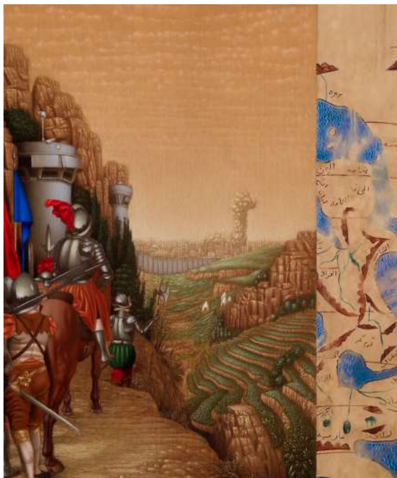
Rayan YASMINEH Le siège , 2025 Huile sur bois, 46 x 38 cm