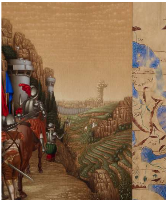
Rayan YASMINEH Le siège , 2025 Huile sur bois, 46 x 38 cm