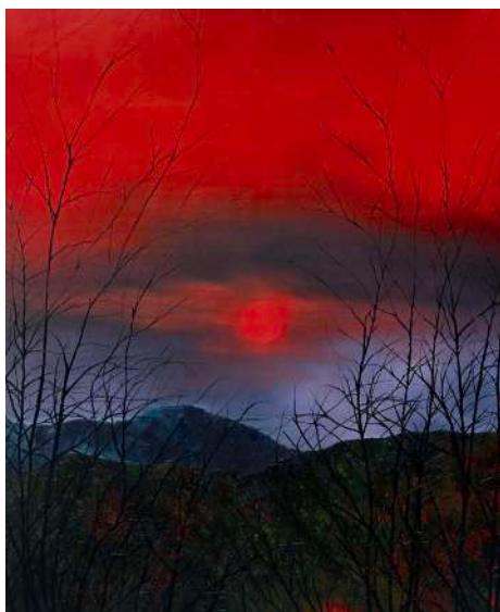
Fabien CONTI Soleil rouge , 2025 Huile sur toile, 200 x 180 cm

En écho à l'exposition que le MO.CO. consacre à l'histoire de l'École Supérieure des Beaux-Arts de Montpellier (MO.CO. Esba), le MO.CO. Panacée propose une réflexion autour d'un « cas d'école » : l'atelier de Djamel Tatah aux Beaux-Arts de Paris. Professeur pendant quinze années au sein de cette institution, Djamel Tatah a formé une génération d'artistes dont la diversité des pratiques, la singularité des trajectoires et la rapide émergence sur la scène nationale intriguent.