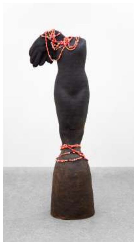
Nina JAYASURIYA Ange Mercure, 2025 Grès, médicaments, mercurochrome 160 x 70 x 45 cm Courtesy galerie Mennour Photo : Archive Mennour