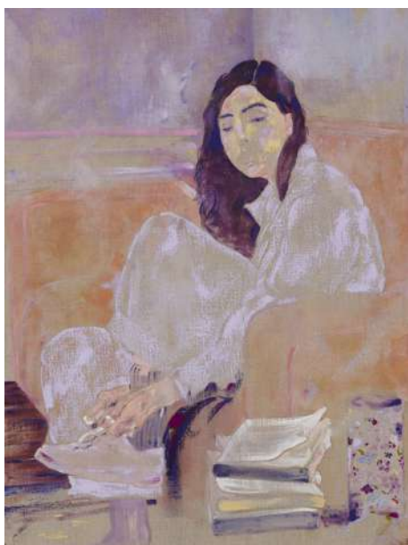
Djabril BOUKHENAÏSSI Tes trente ans , 2025 Huile et pastel sur toile, 80 x 54 cm