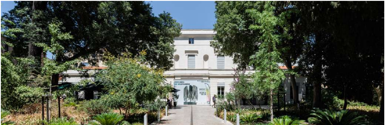
MO.CO. Montpellier contemporain, 2022