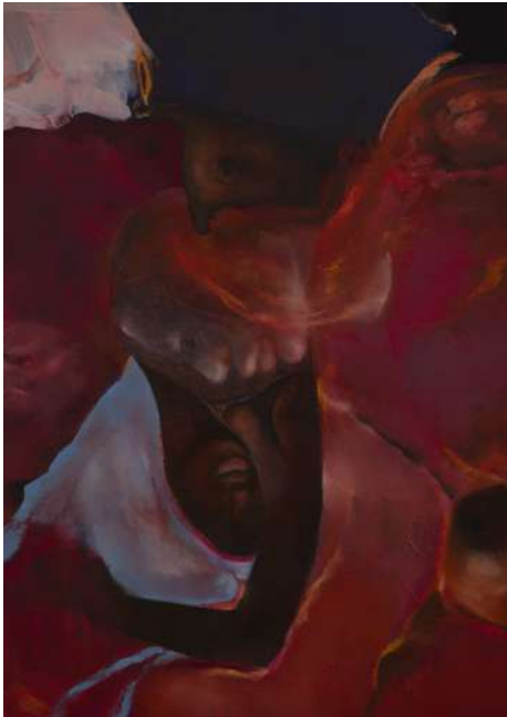
Clémence GBONON Secret Gardens , 2024 Huile sur toile, 116 x 89 cm Collection privée

cette constellation, ce qui relie ces artistes n'est pas une esthétique commune mais l'expérience partagée d'avoir été accompagnés dans leur devenir artiste. Plus qu'un héritage formel, l'exposition célèbre une transmission entendue comme un passage, un élan, une invitation à tracer son propre chemin.