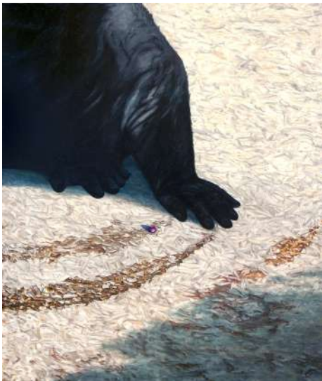
Blaise SCHWARTZ Mouvement au sol , 2023 Huile sur toile, 100 x 80 cm Courtesy de l'artiste © Blaise Schwartz