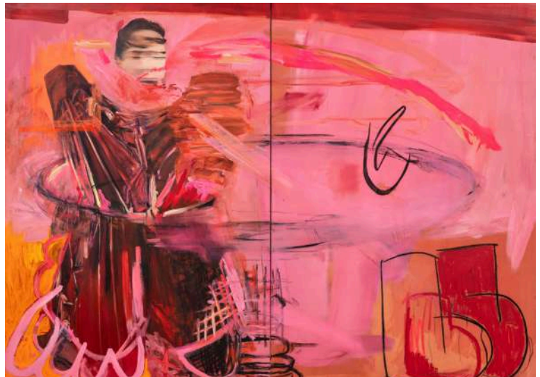
Dora JERIDI Where to go? How to go? , 2023 Huile, bâton d'huile, fusain sur toile, 195 x 260 cm Collection Société Générale. Courtesy Perrotin © Adagp, Paris, 2026