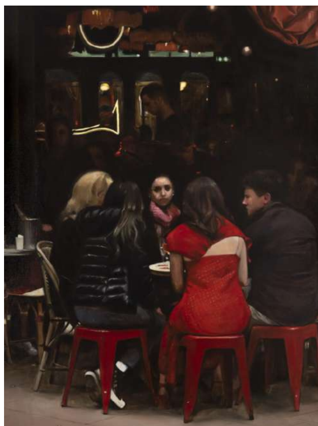
Bilal HAMDAD Vermillon , 2024 Huile sur toile, 162 x 130 cm Courtesy galerie Templon © Adagp, Paris, 2026