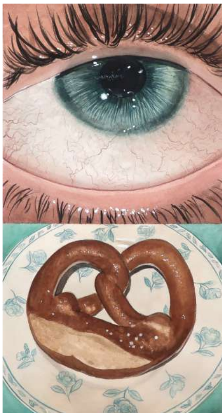
Léo DORFNER Controlling my feelings for too long, 2025 Aquarelle sur papier, 70 x 50 cm Courtesy galerie Claire Gastaud © Adagp, Paris, 2026