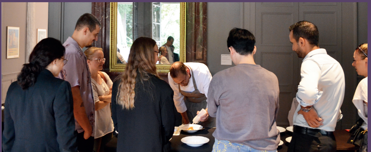
VALOTEL au MO.CO., 2023