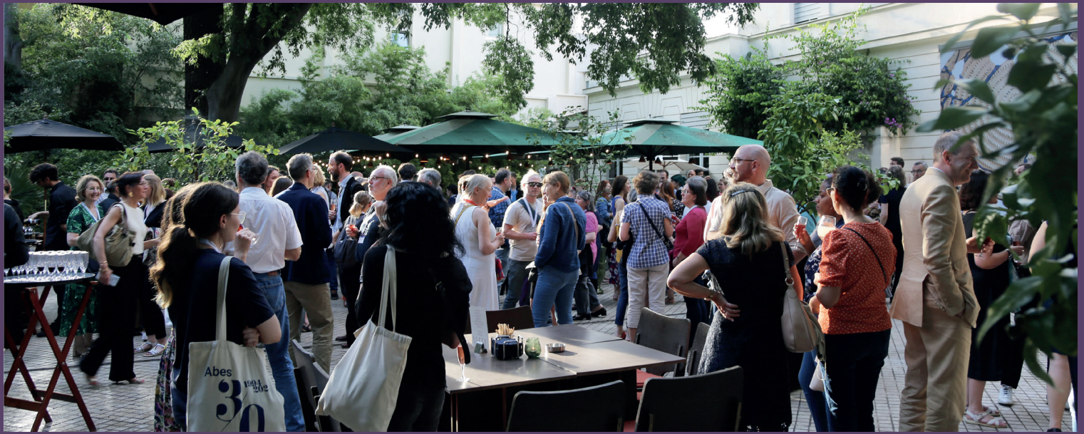
Journée ABES au MO.CO., 2024