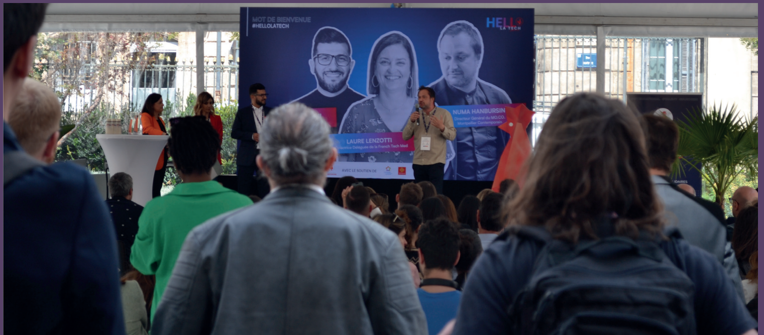
FRENCHTECH au MO.CO., 2023