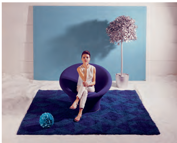
Fauteuil F562 dit Big Mushroom, Pierre Paulin pour Artifort, 1960.