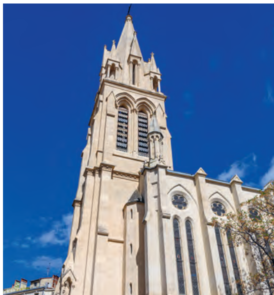
Musée Carré Sainte-Anne