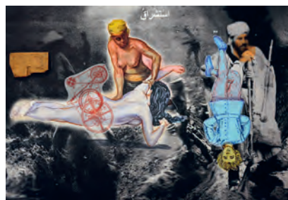
Mohamed Lekleti Gravé au burin de l'histoire, 2022 Technique mixte sur papier marouflé sur bois, 110 x 160 cm Collection Frac Occitanie Montpellier © Adagp, Paris 2026

4-6 rue Rambaud - Montpellier Ouvert du mardi au samedi 14h-18h (juillet-août : 15h-19h) 04 99 74 20 35 - www.frac-om.org Entrée libre