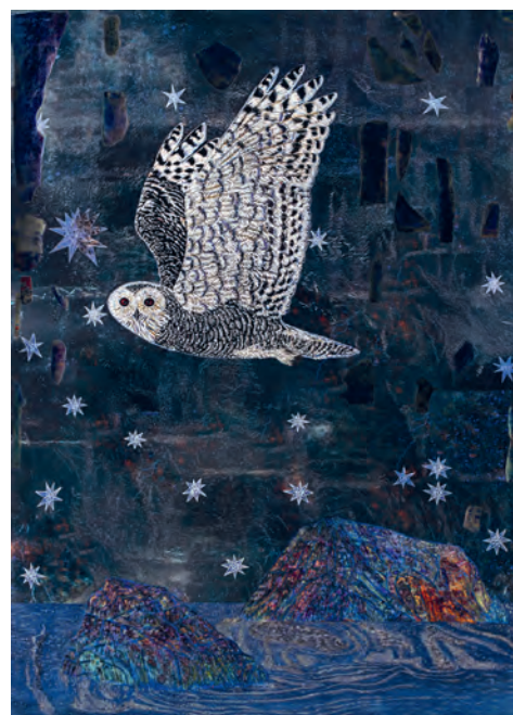
Evening Star, 2023 Impression numérique, feuille d'or blanc sur papier Hahnemühle Digital print, white gold leaf on Hahnemühle paper Exemplaire EA 6/7 152x x 110 cm Courtesy Magnolia Editions et Galerie Lelong © Kiki Smith